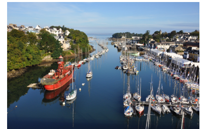
le port de Douarnenez

Le programme peut être sujet à de légères modifications.